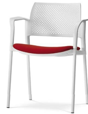
Dream+ 100-WH/B-N0 ■