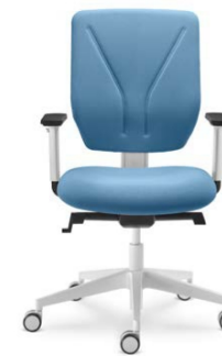
331-SYS ■ + BR-209/WH