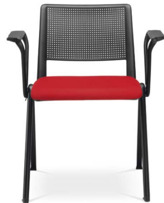
60! 115-N1 ■ + BR-112