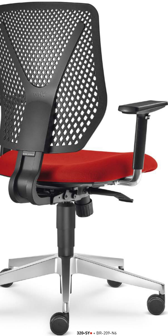
320-SY ■ + BR-209-N6