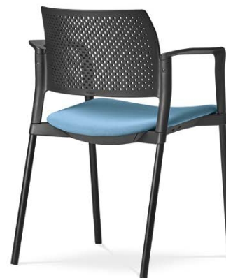
Dream+ 100-BL/B-N1 ■