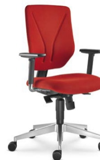
330-SY ■ + BR-209-N6