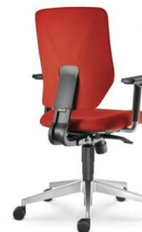
330-SY ■ + BR-209-N6