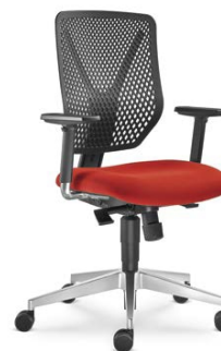
320-SY ■ + BR-209-N6