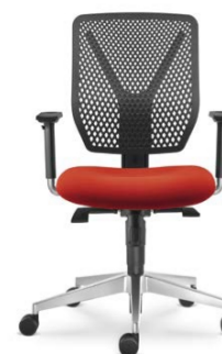
320-SY ■ + BR-209-N6