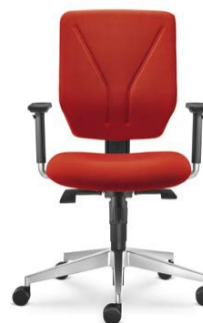
330-SY ■ + BR-209-N6