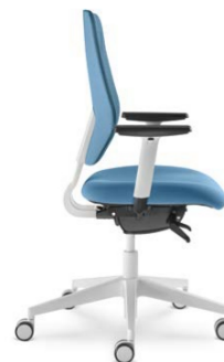
331-SYS ■ + BR-209/WH