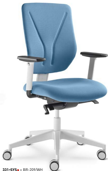
331-SYS ■ + BR-209/WH