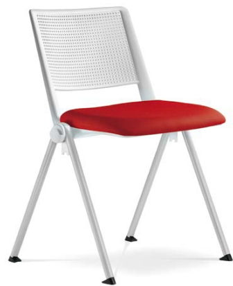
GO! 116-N0 ■