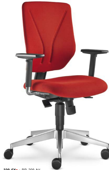
330-SY ■ + BR-209-N6