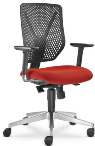
320-SY ■ + BR-209-N6

Pour compléter les chaises Why, nous vous recommandons les chaises Dream+ ou les chaises Go! en tant que les chaises de visite. Il est également possible d'équiper ces chaises par des éléments blancs et noirs, les dos des chaises sont aussi fortement perforés.