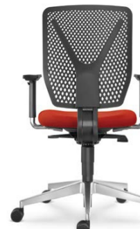
320-SY ■ + BR-209-N6