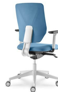
331-SYS ■ + BR-209/WH